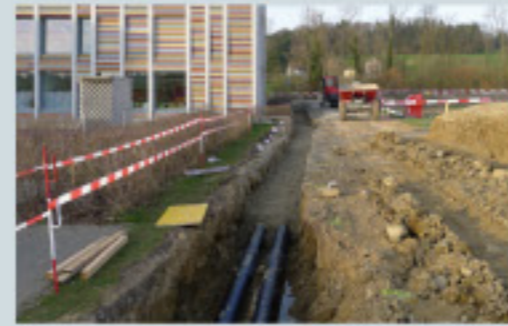
ProgrammtTeilnehmer: Abwasserwärmenutzung ARA Schönau - Überbauung Hofmatt, 6330 Cham

Die Stiftung KliK hat 196 Einzelprojekte, 361 Unternehmen sowie 17 Programme unter Vertrag, welche per Ende 2020 voraussichtlich insgesamt 5,95 Mio. Tonnen CO 2 -Emissionen reduzieren.