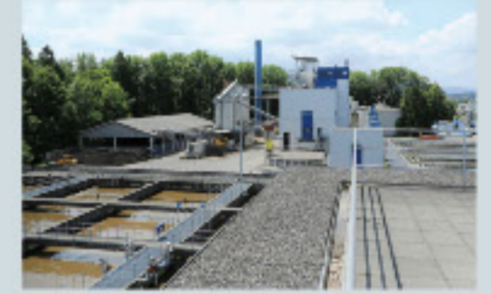
Abwasseranlage REAL, 6032 Emmen; Videoreportage auf www.jahresbericht.klik.ch

Projekt REAL Abwasser Emmen Erwartete Anzahl Bescheinigungen bis 2020: 20'000